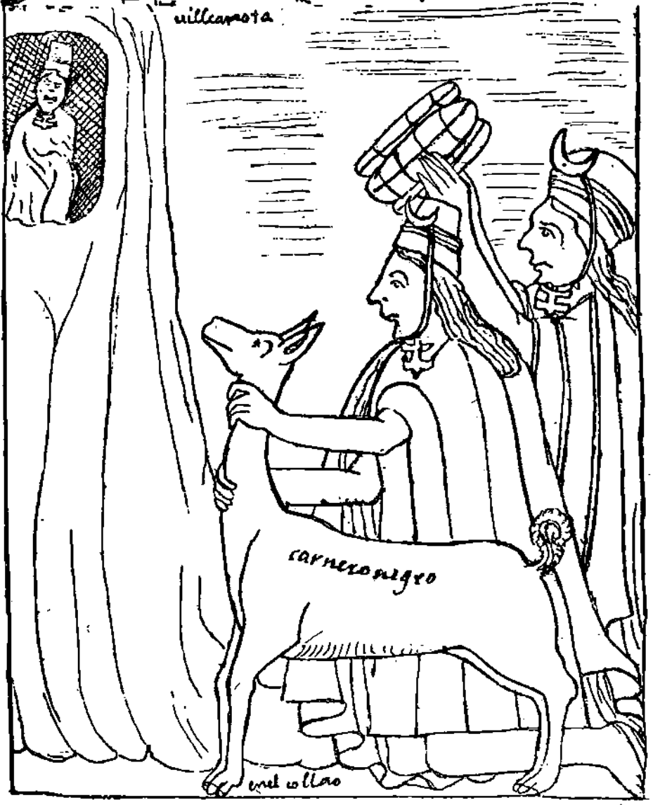
fig. 1: (pág 270). Ofrenda de lo que parecen ciertos de coca en Villcanota.