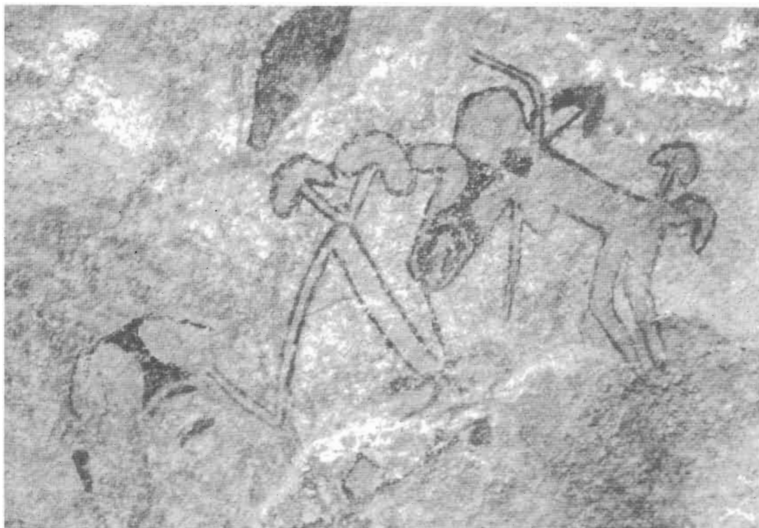
Fig. 10: Tin-Abouteka, Tassili algerino. Periodo delle "Teste Rotonde".