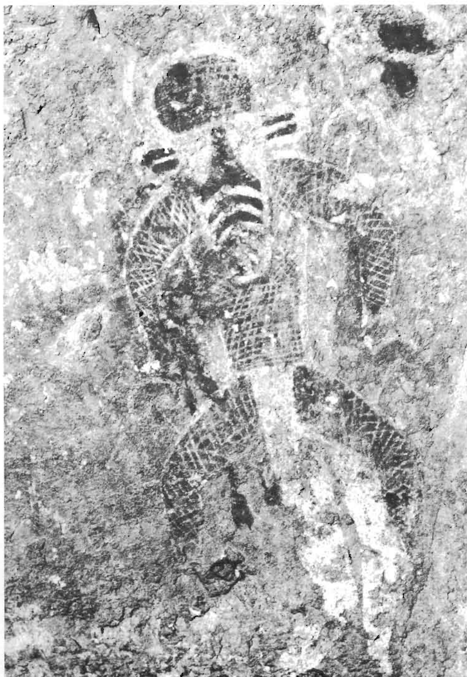
Fig. 8: In-Aouanrhat, Tassili algerino. Figura con maschera (divinità?). Nella struttura della maschera è riconoscibile l'immagine di un grosso fungo; altri funghi spuntano dagli avambracci e dalle cosce dell'essere antropomorfo. Periodo delle "Teste Rotonde" (da Lajoux J.D., 1964).